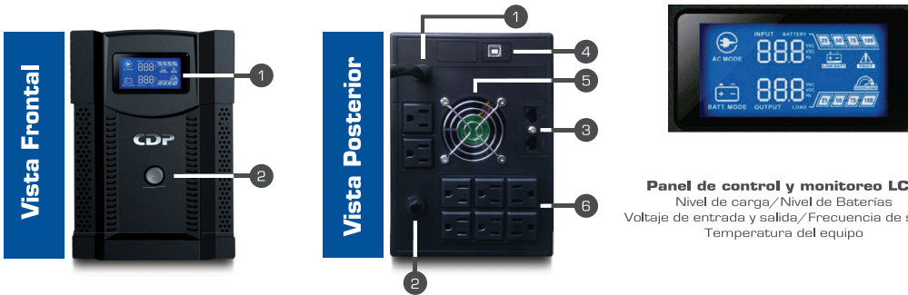
Panel de control y monitoreo LCD Nivel de carga/Nivel de Baterías Voltaje de entrada y salida/Frecuencia de salida Temperatura del equipo

La UPRS es una serie avanzada de UPS de línea interactiva que producen energía con onda senoidal pura para su equipo. El UPRS 1508 ha sido concebido para aplicaciones corporativas que necesitan un alto nivel de protección superior. Su pantalla LCD frontal le mantendrá al tanto de las condiciones del UPS, mientras que el software incluido, le permitirá programarlo para que realice instrucciones específicas, tales como bitácora de operación, apagado automático del sistema operativo, cierre seguro de archivos, entre otros. A diferencia del tradicional UPS interactivo, la serie UPRS provee una transferencia muy corta cuando ocurre un corte de energía, y una eficiencia hasta del 98% en condiciones normales de energía.