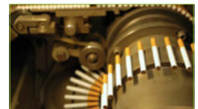
Fábricas de cigarro