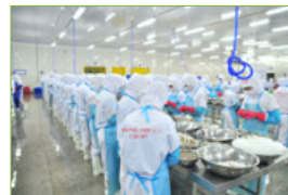
Fábricas de alimentos