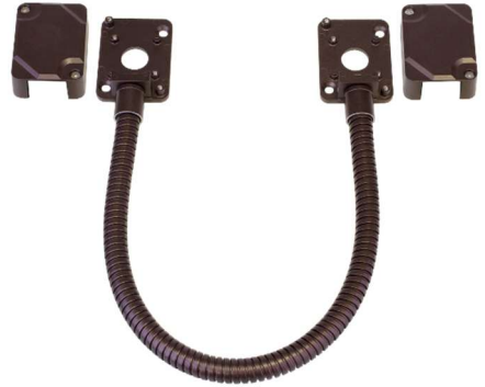
Se muestra el SD-969-M15Q/B.