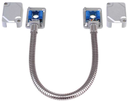
Se muestra el SD-969-T15Q/S.

-Diseñado para transportar el cableado que conduce la energía a cerraduras eléctricas o sistemas de acceso instalados en puertas/portones.