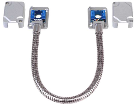
Se muestra el SD-969-T15Q/S.

NOTA: Cada terminal está cableado de forma individual.