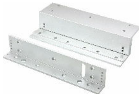
Soporte en Z

Para cerraduras electromagnéticas de 600 lb