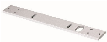
Placa de cabecera