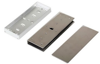
Soporte en U (para puertas de vidrio)