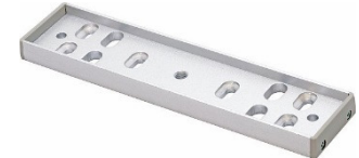
Soporte de placa de armadura