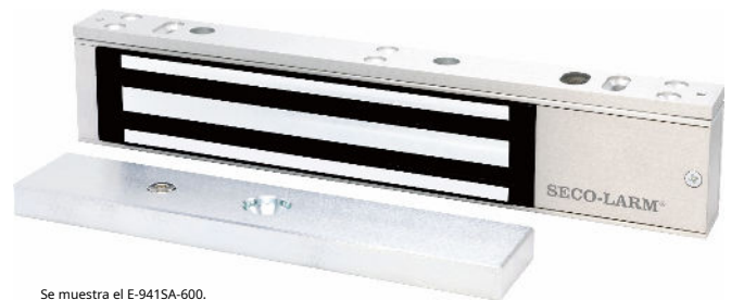
Se muestra el E-941SA-600.