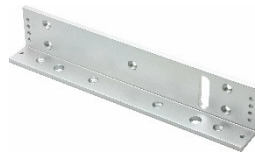
Soporte en L