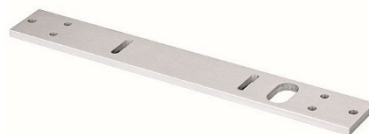
Espaciador de placa