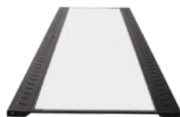
PUERTA DE CRISTAL