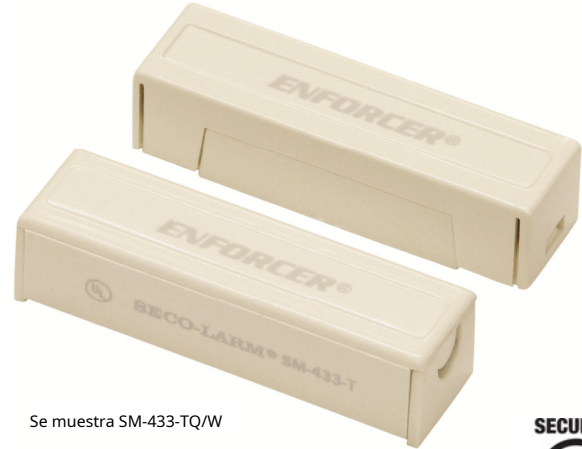
Se muestra SM-433-TQ/W